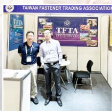
台灣螺絲貿易協會