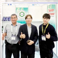
台灣螺絲工業同業公會